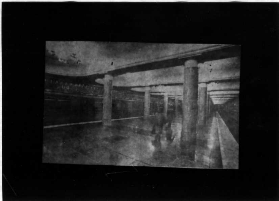
Станция Ясенево имеет два типа сводчатых потолков и 12 выходов. Рядом установлены бронзовые скульптурные композиции авангардного характера. Вокруг станции — парк. "ЯСЕНЕВО" /Москва/

Это показывает, что в 1990 году в конкурсе победила станция "Ясенево". "СТАНЦИЯ ГОДА" 1990.