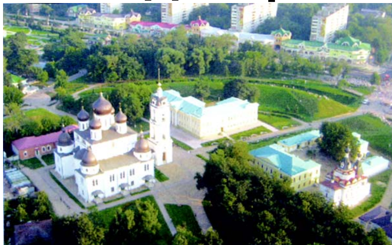
Вид на Кремль.

Мы чаще всего выбираем для путешествий дальние дороги. И невольно проходим мимо того прекрасного, что рядом с нами. Осенью прошлого года я побывал в подмосковной санатории, расположенной в живописном месте недалеко от старинного города Дмитрова, который, конечно же, посетил, и он оставил в памяти неизгладимое впечатление. Чудо-город, основанный в 1154 году Юрием Долгоруким, всегда готов встретить туристов и подарить им поистине увлекательное путешествие. Всего 60 километров от Москвы – и вы, уважаемые метростроители, в Дмитрове, который не так давно указом президента России Д.В. Медведева достоин звания «Город воинской славы».