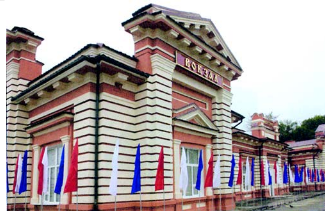
С Савеловского вокзала Москвы электропоезд прибывает в Дмитров, на вокзал, здание которого оставляет самое приятное впечатление.