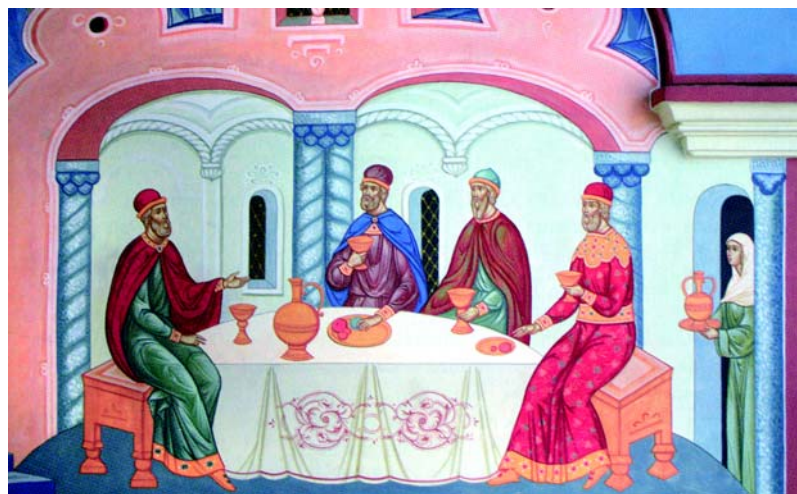
Роспись Успенского собора.

сюда с дружиной собирать дань. Правда ли то, что вместе с ним была его жена, родившая здесь ребенка, которому было дано имя Всеволод (Всеволод Большое Гнездо), доподлинно неизвестно. Скорее всего, Юрий Долгорукий получил известие о появлении сына на свет, будучи уже здесь. Но, так или иначе, а при крещении Всеволод получил второе имя, Дмитрий, в честь святого великомученика Дмитрия Солунского, почитаемого на Руси. И это же имя было дано городу.