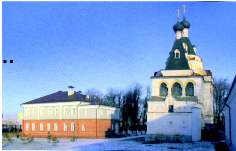
Музей-заповедник «Дмитровский кремль». Тюремная церковь и здание бывшего Дворянского собрания.

Выйдя из музея, туристы обращают внимание на комплекс зданий Присутственных мест или «Тюремный замок». На самом деле когда-то в этих корпусах располагалось Полицейское управление, Уездное казначество, Лесничество и... уездная тюрьма. Туристам предоставляется возможность побродить здесь по тюремному дворику, по его брусчатке позапрошлого века. И с интересом послушать рассказ