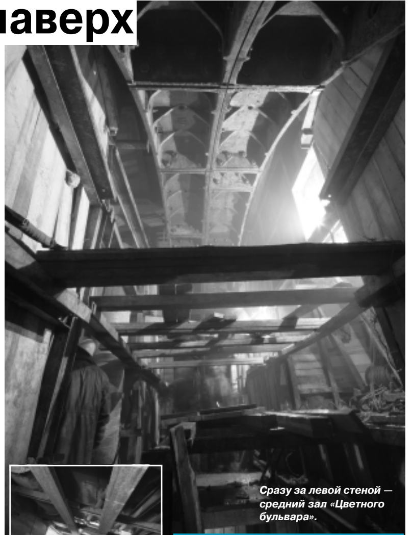
Сразу за левой стеной — средний зал «Цветного бульвара».