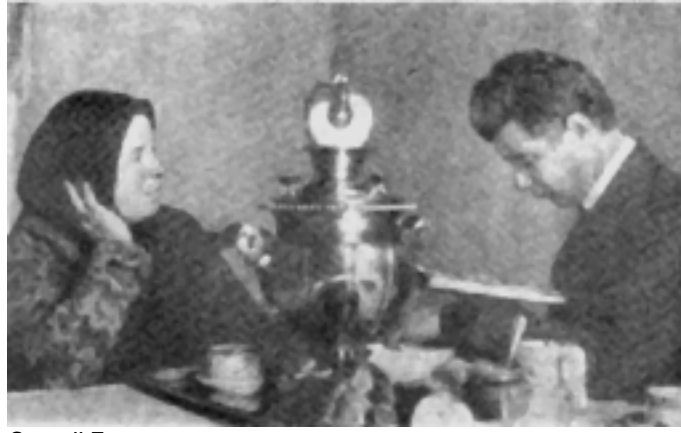
Сергей Есенин читает матери главы из поэмы «Анна Снегина». 1925 год.