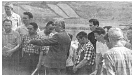
На практических занятиях с тоннельщиками.