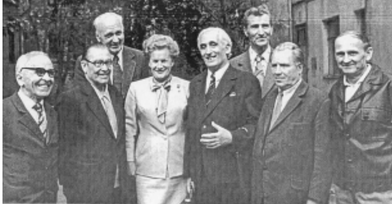
С группой метростроевцев.

метизации, позволяющие вести бескессонную проходку.