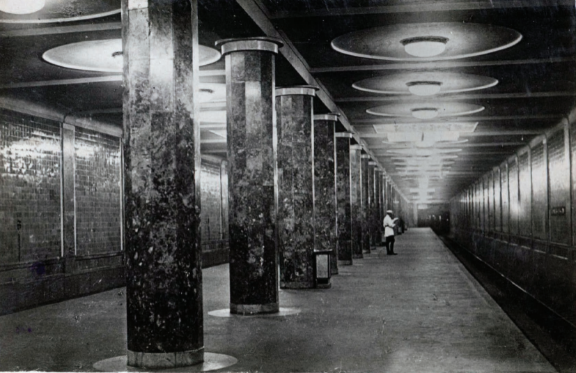
* Ст. «Красносельская» Платформа. Station „Krasnoselskaja“ Platforme.