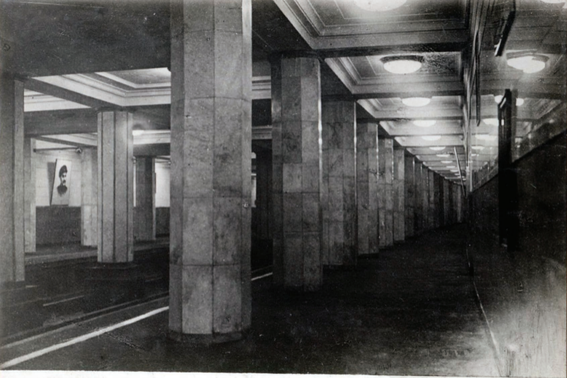
26. Ст. Ул. Коминтерна Station „Rue Comintern“