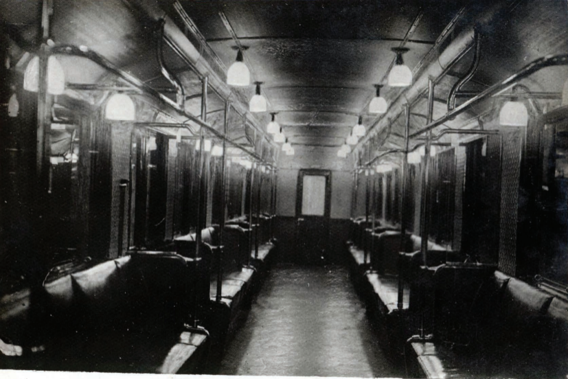
33. Вагон - внутренний вид. Voiture-interieur.