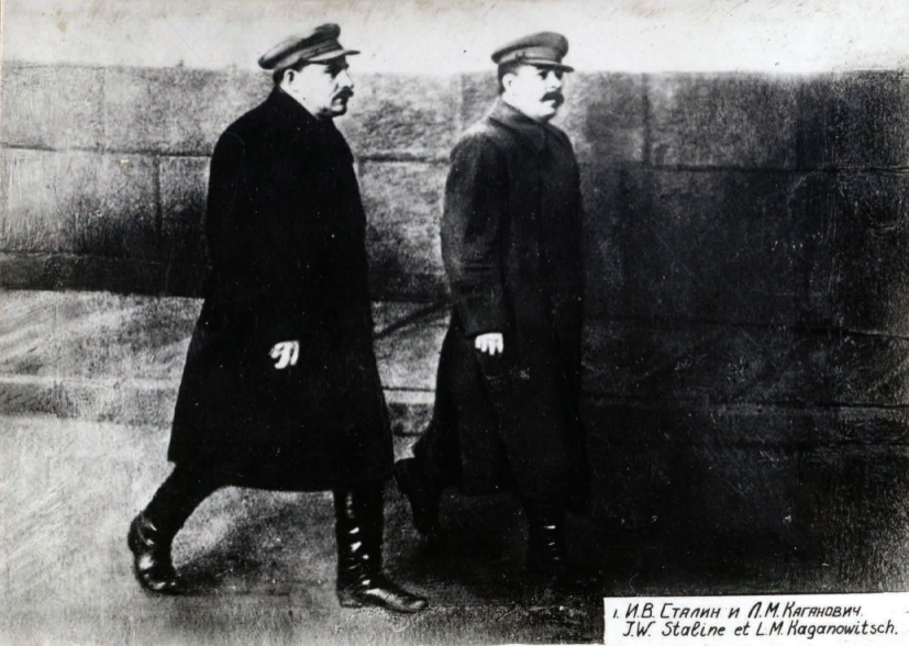
1. И.В. Сталин и Л.М. Каганович. J.W. Staline et L.M. Kaganowitsch.