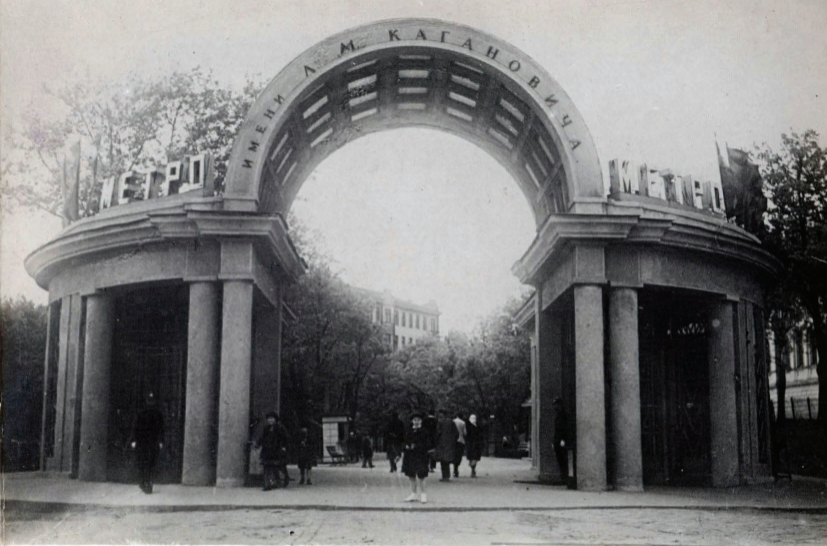
22. Ст. "Дворец Советов" Вестибюль. Station "Palais des Soviets" Entrée