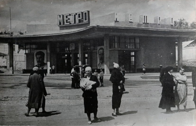
Ст. Красносельская. Вестибюль. Station „Krasnoselskaja“ Entrée.