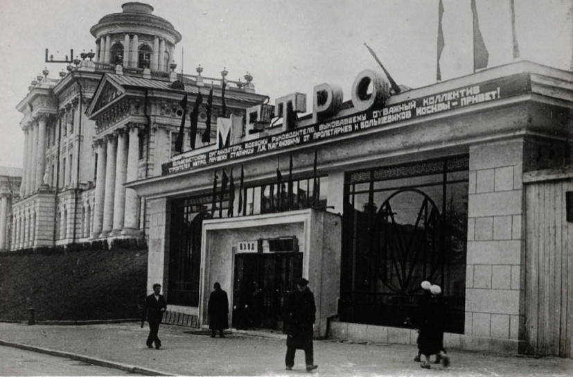
20. Ст. „Библиотека Ленина“ Вестибюль. Station „Bibliothèque Lenine“ Entrée.