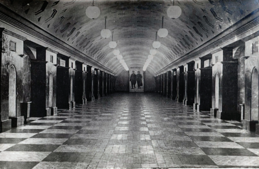
9. Ст. „Красные Ворота.“ Station „Porte Rouge.“