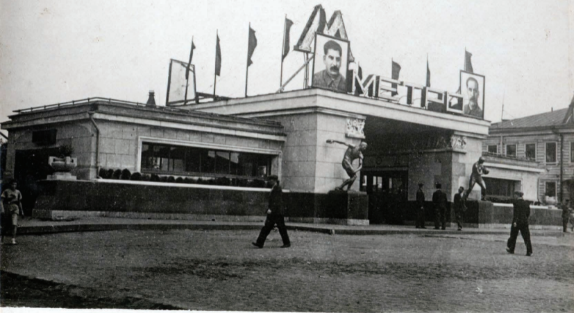
3. Ст. „Сокольники“ Вестибюль. Station „Sokolniki“ Entrance