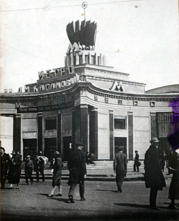
28. Ст. „АРБАТСКАЯ.“ ВЕСТИБЮЛЬ. Station „Arbatskaja.“ Entrée.