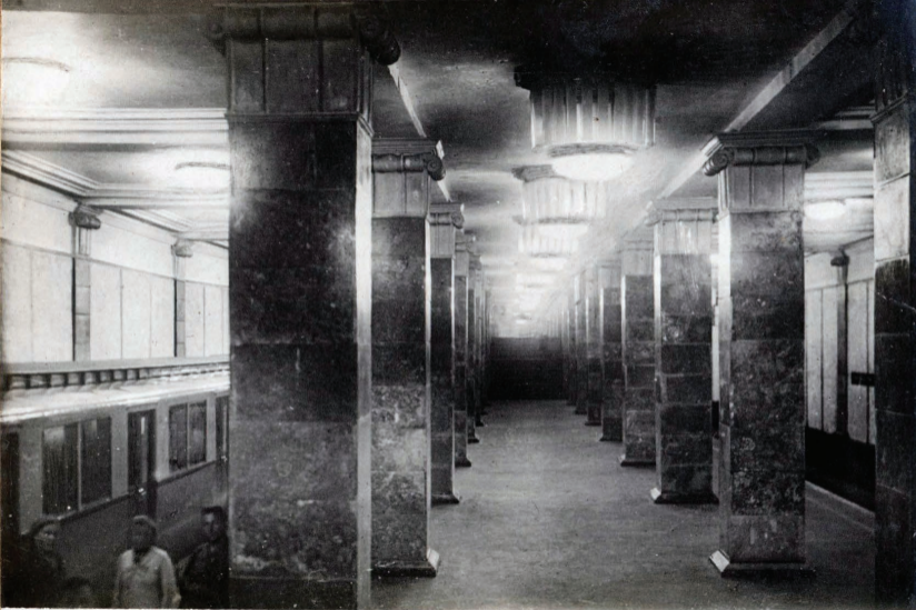
25. Ст. "Парк Культуры им. М. Горького." Station "Park de Culture M. Gorki."