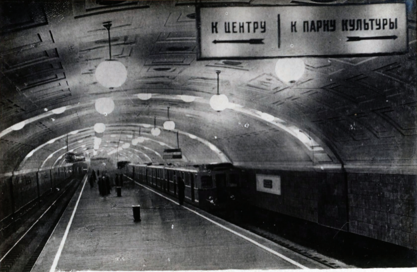
19. Ст. «Библиотека Ленина» Station „Bibliothèque Lenine.”