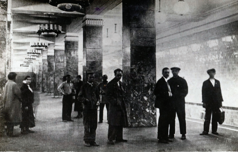
27. Ст. „АРБАТСКАЯ.“ Station „Arbatskaja.“