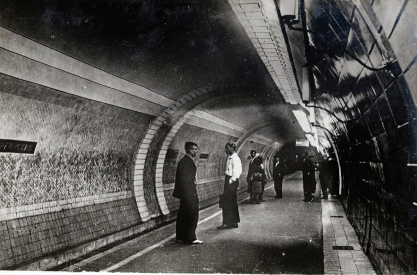
13 Ст. Дзержинская. Платформа. Station „Dzerzhinskaja“ Platforme.