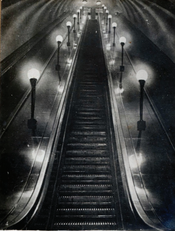
15. Ст. ДЗЕРЖИНСКАЯ. ЭСКАЛАТОР. Station „Dzerzjinskaja“ Escalateur.