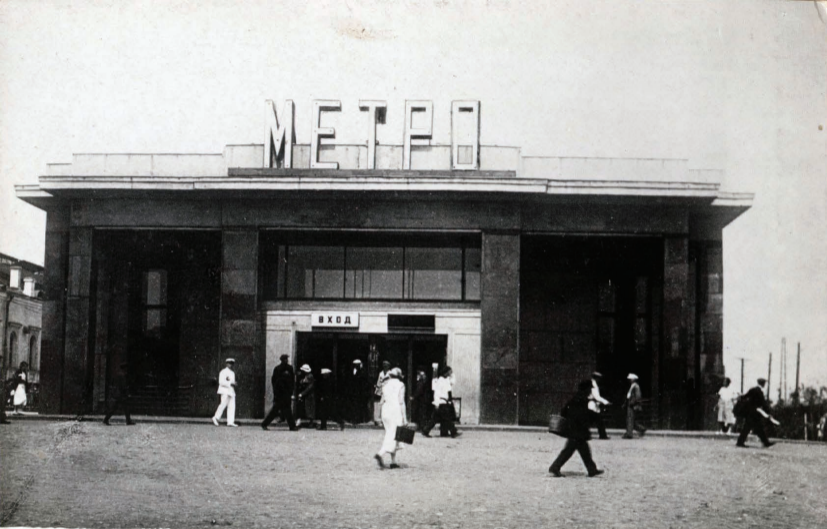
8. Ст. „Комсомольская“ Вестибюль Station „Komsomolskaja“ Entrée