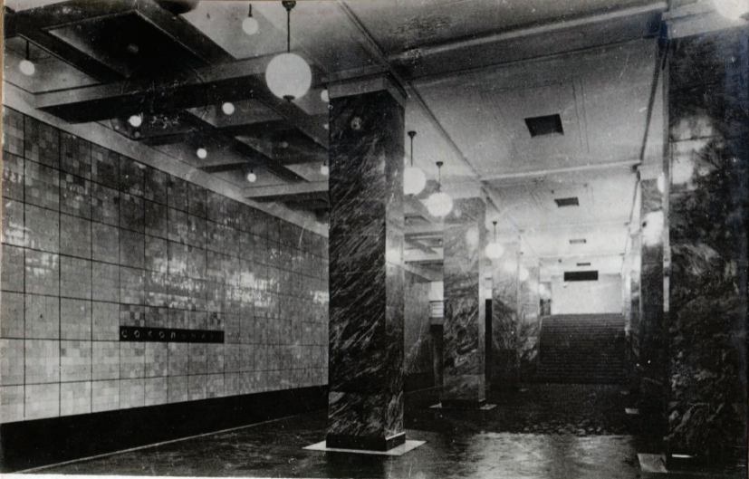
2. Ст. „Сокольники“ Station „Sokolniki“.