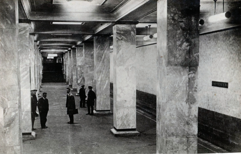
29. Ст. „СМОЛЕНСКАЯ“ Station „Smolenskaja“.