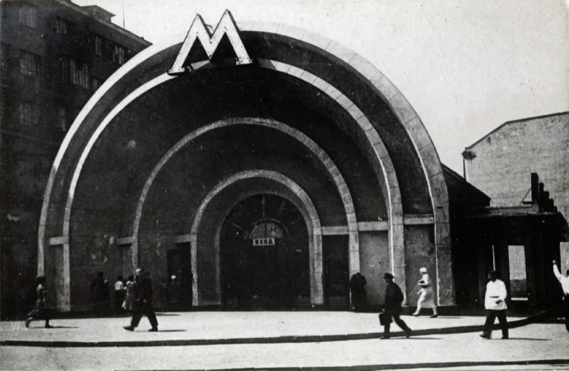
10. Ст. „Красные Ворота“. Вестибюль. Station „Porte Rouge“. Entrée.