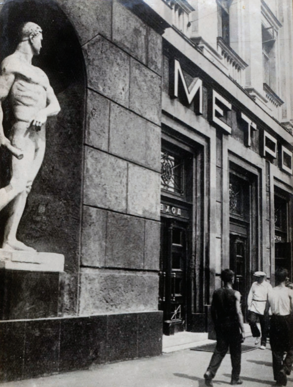
18. Ст. Охотный ряд: Вестибюль. Station Ochotni Ryad: Entrée.