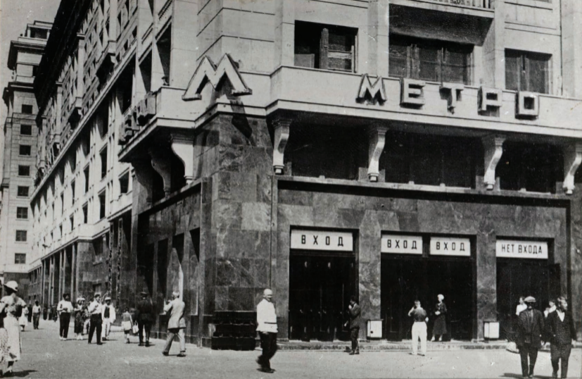
17. Ст. „Охотный ряд“ Вестибюль. Station „Ochotni Rjad“ Entrée.