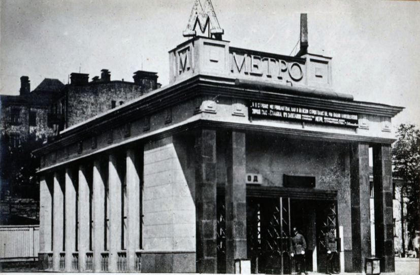
24. Ст. "Парк Культуры им. М. Горького." Вестибюль. . . Station "Park de Culture M. Gorky." Entrée.