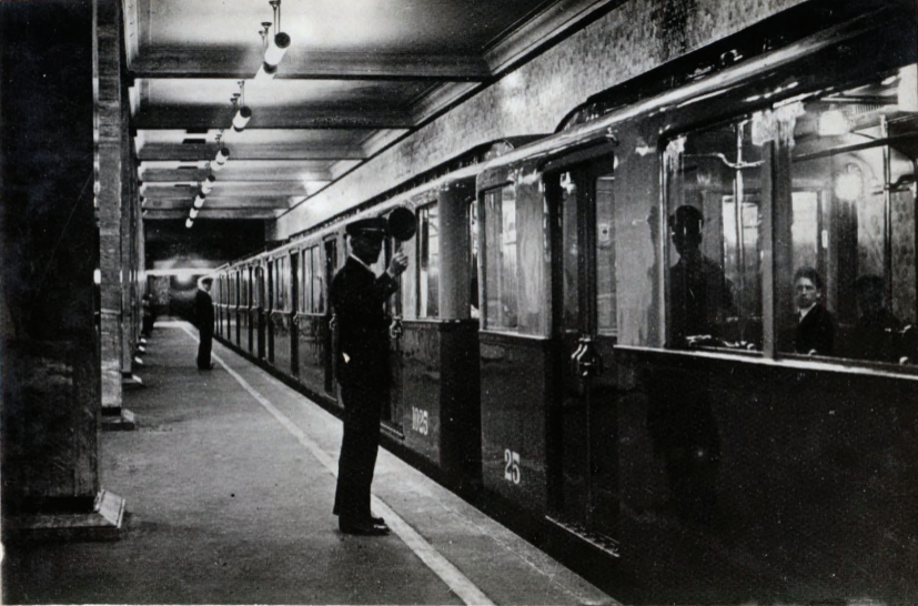
32. Поезд Московского метрополитена Train du Métropolitain de Moscou.