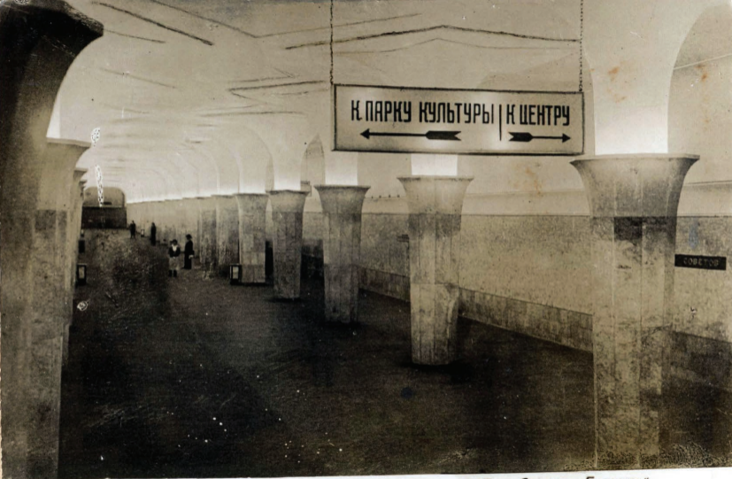
21. Ст. "Дворец Советов." Station "Palais des Soviets."