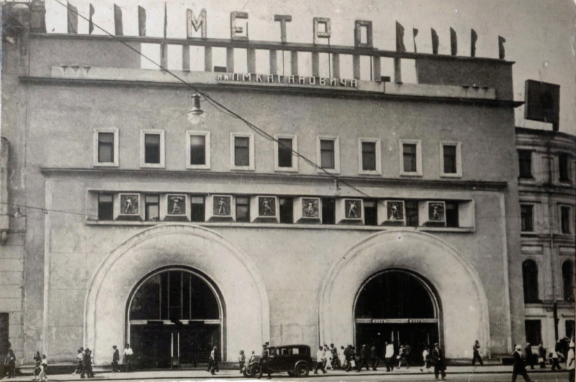
14. Ст. ДЗЕРЖИНСКАЯ. ВЕСТИБУЛЬ. Station „Dzerzhinskaja“ ёнтрёе.