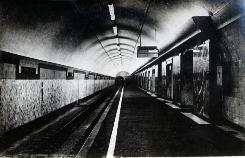
II. Ст. Кировская. Платформа. Station Kizovskaja. Plateforme.