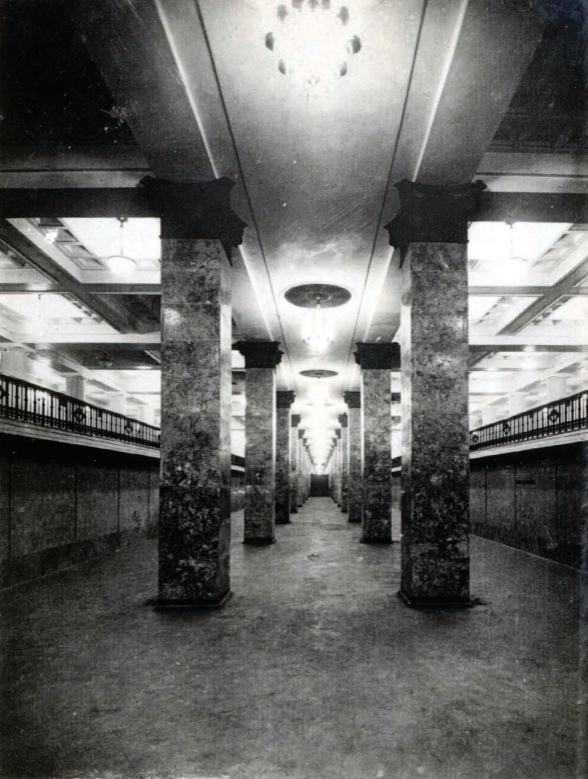
6. Ст. Комсомольская. Платформа. Station „Komsomolskaja“ Platforme.