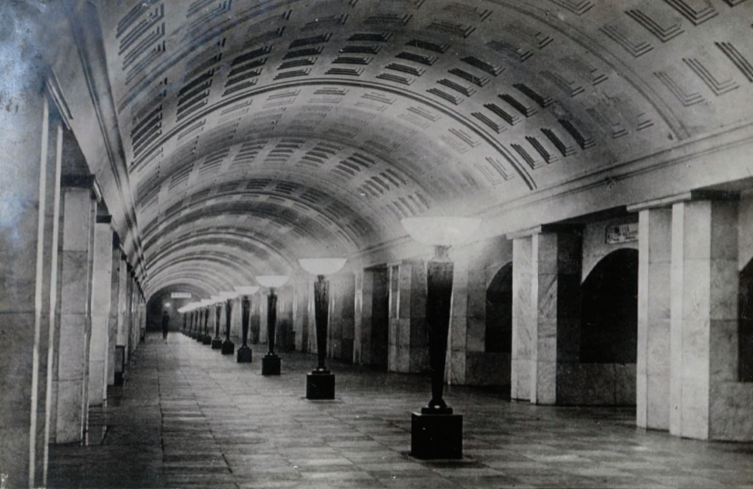
16. Ст. „Охотный ряд“ Station „Ochotni Rjad“