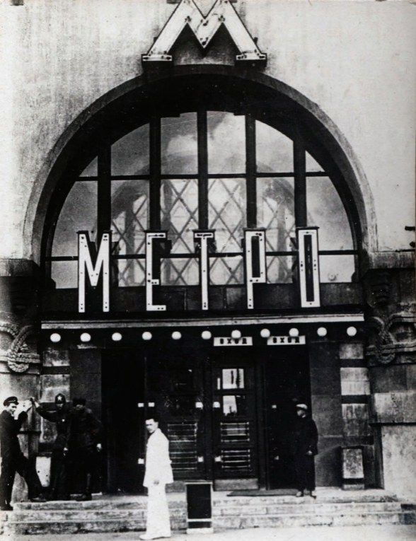
7. Ст. Комсомольская." Вестибюль. Station "Komsomolskaja." Entrée