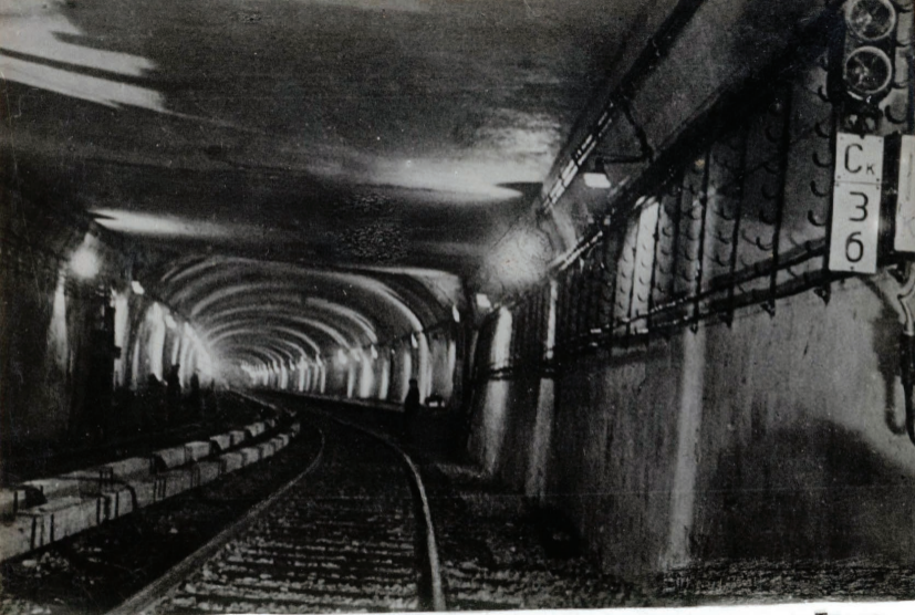
31. Тоннель. Топлев.