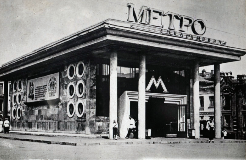
12. Ст. Кировская. Вестибюль. Station „Kizovskaja“ Entrance.