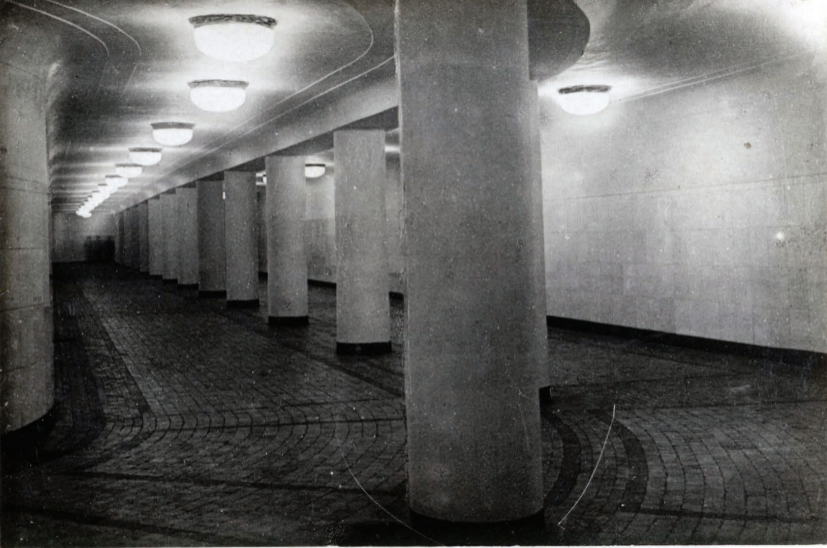
23. Ст. „Дворец Советов“ Переходы. Station „Palais des Soviets“ Couloirs.